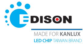
LEDS-P 4W/M -IP54